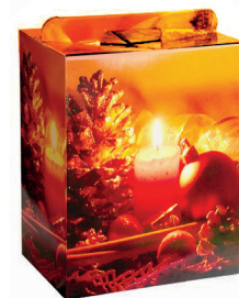
Fiocco di Natale